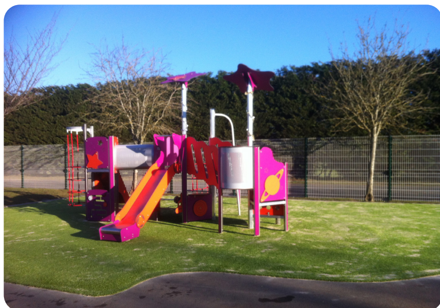
Réalisations à Bréhal et Auvers (50)